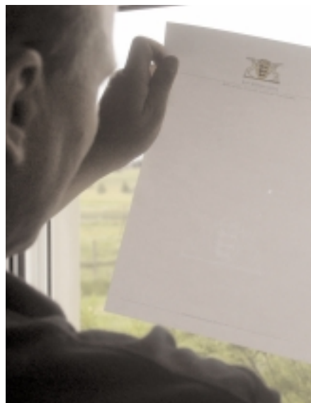
... unmittelbar nach dem Eindringen der Flüssigkeit in das Papier wird das Ergebnis sichtbar: Das Motiv wirkt in Auf- und Durchsicht wie ein echtes Wasserzeichen!

ANWENDUNG IM ALLTAG. Der Einsatz individueller Wasserzeichen ist naheliegend zum Beispiel bei öffentlichen Institutionen, der Pharma-Industrie, Finanzdienstleistern,