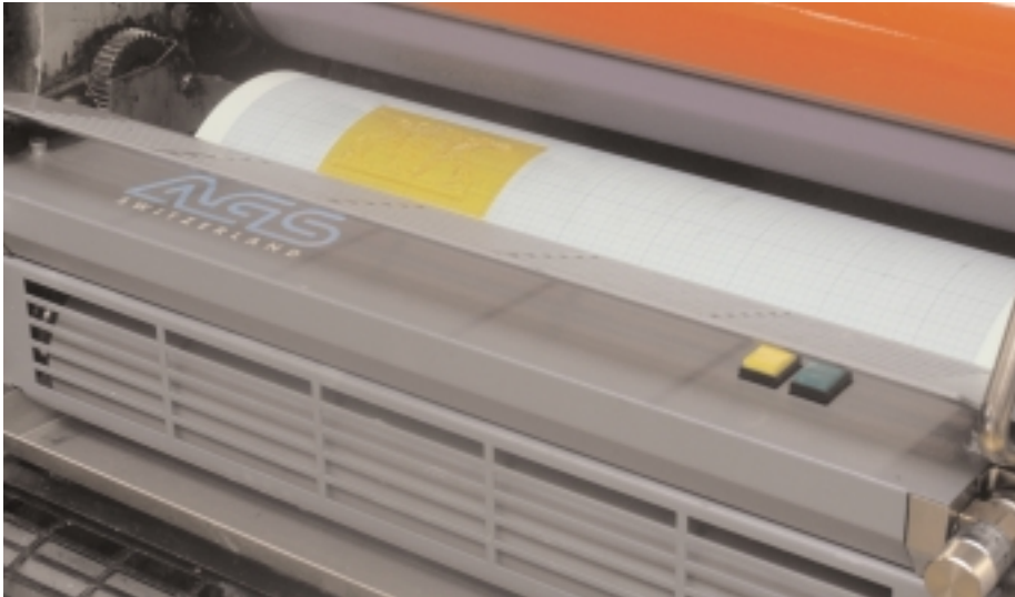
Das Herzstück der Anlage ist diese kompakte Dosier-Einheit. Sie sorgt dafür, dass Blatt für Blatt immer exakt die gleiche Menge Inmarque-Flüssigkeit zur Verfügung steht.