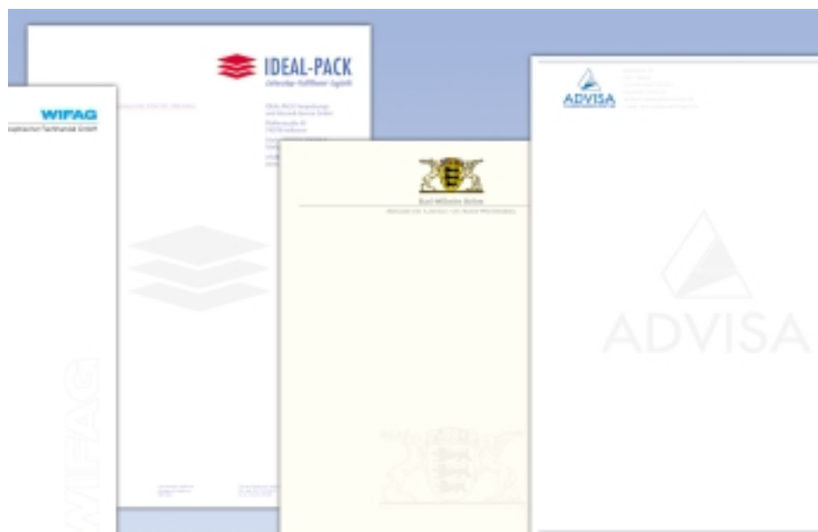
Anwendungsbeispiele aus der Praxis: Gezeigt werden hier mit dem Inmarque-Wasserzeichen produzierte Geschäftsbriefbögen.

PRESTIGE UND KREATIVITÄT. Auch noch heute ist ein Papier mit einem eigenen Wasserzeichen ein seltenes Privileg – ein Statussymbol für hohes Ansehen.